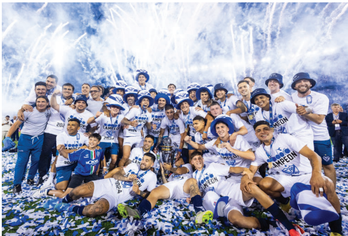
Un verdadero campeón que jugó todos los partidos decisivos de 2024 y en diciembre tuvo su ansiada coronación.