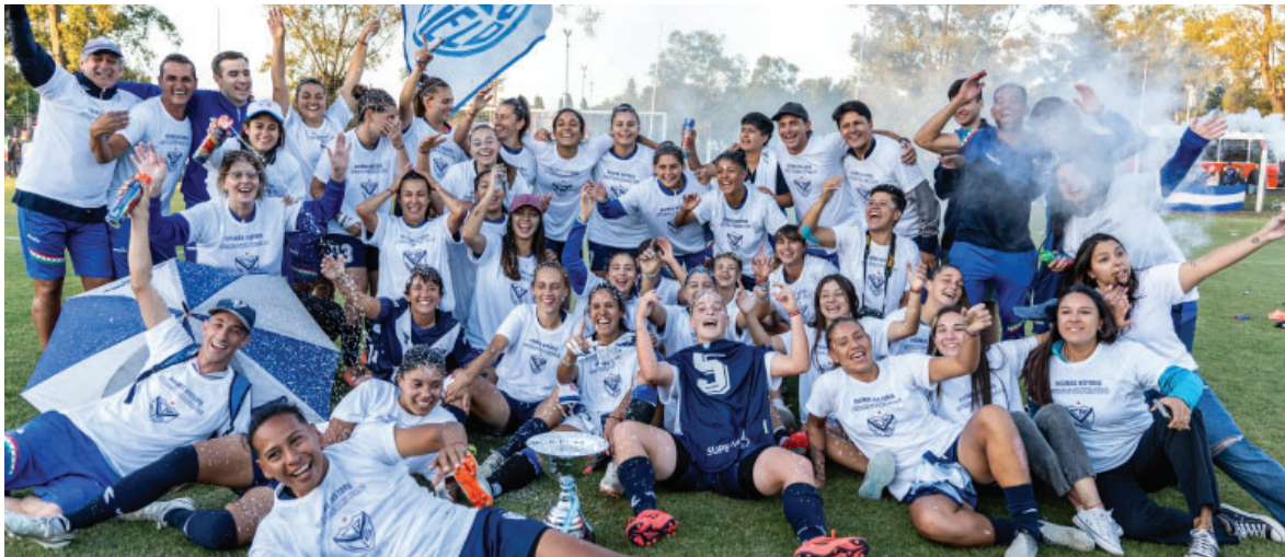
El Fútbol Femenino y un momento histórico: primer ascenso a la máxima categoría.