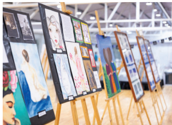
Exposiciones artísticas y culturales en el Quincho.