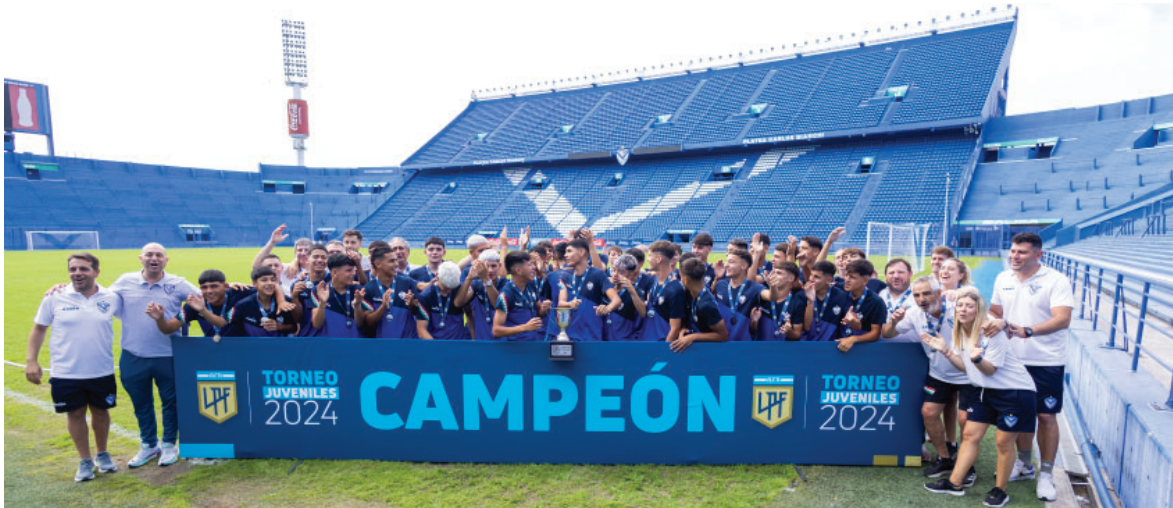
La categoría 2008 (séptima división) celebra un nuevo título, el segundo consecutivo de AFA juvenil.