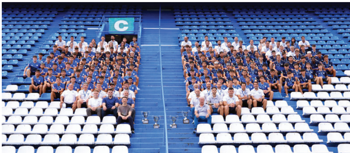
La Fábrica y una temporada inolvidable con cuatro títulos. Jugadores, CT, Staff de F. Amateur y CD reunidos en la premiación.

Ejercicio 115 - Del 1 de julio de 2024 al 30 de junio de 2025