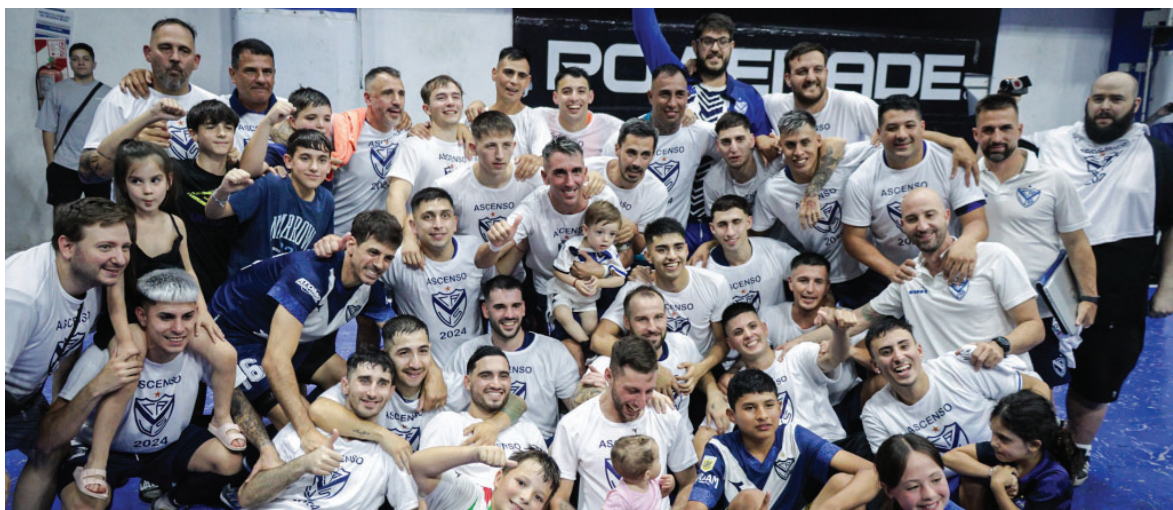
El primer equipo masculino de Futsal logró ascender a la Primera B luego de un 2024 soñado.