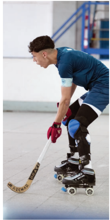
Hockey sobre patines en Vélez.