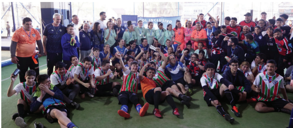
Festejos de la Copa Inclusión en el Polideportivo. Gran número de deportistas e invitados disfrutaron de una gran jornada.