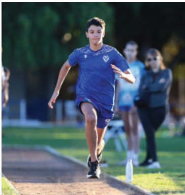
Atletismo en el Polideportivo.