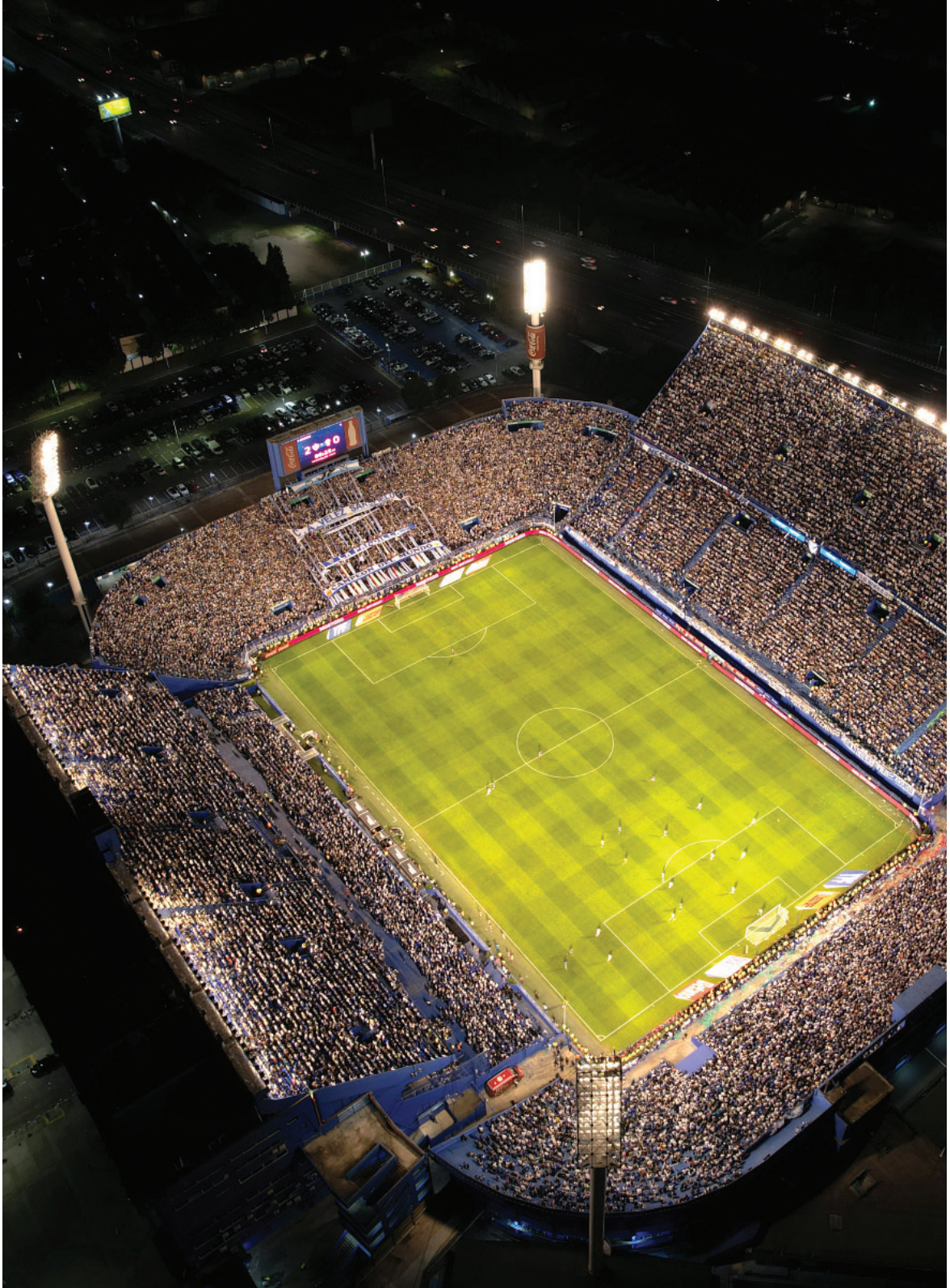
Una postal soñada. El Estadio José Amalfitani en plenitud para contemplar a Vélez Campeón de la Liga Profesional de Fútbol 2024