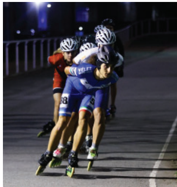
Patín Carrera en el Polideportivo.