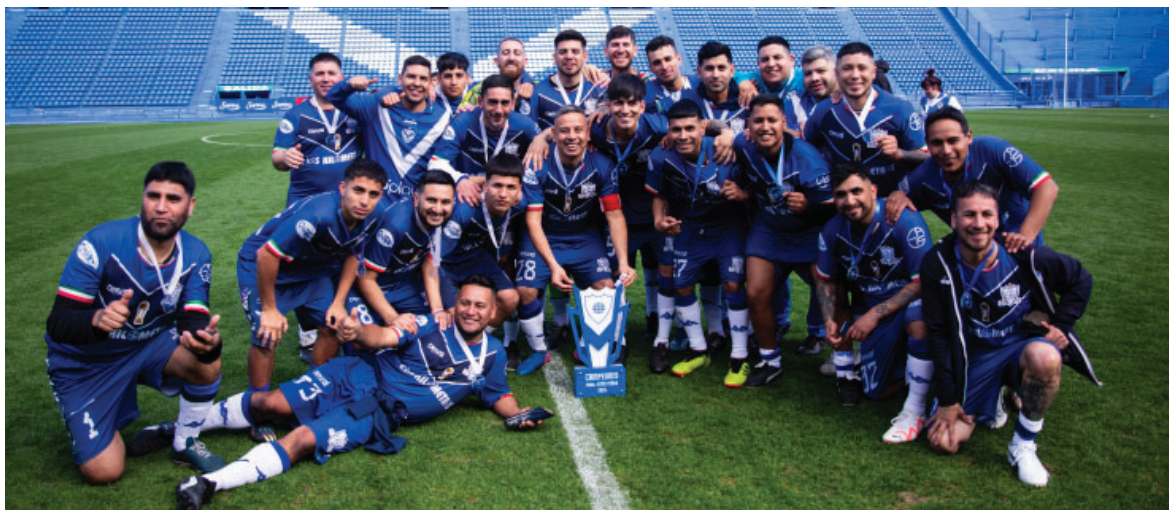
El equipo campeón del Torneo Interpeñas festejando el título en casa.