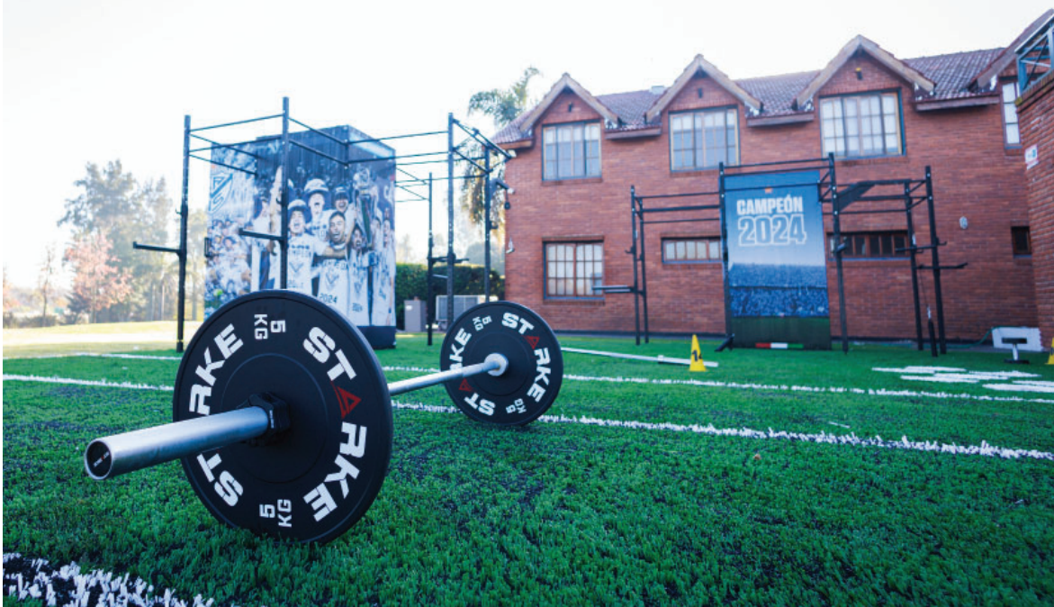
Duplicación del espacio perteneciente al Gimnasio de Fútbol Profesional en la Villa Olímpica junto al sponsor Starke.