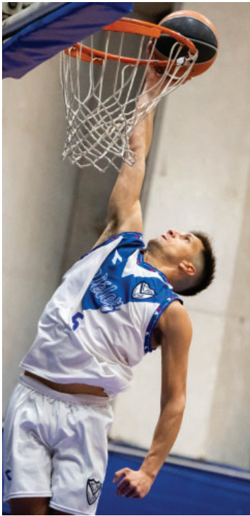
Básquet en el Estadio Víctor Barba.

Ejercicio 115 - Del 1 de julio de 2024 al 30 de junio de 2025