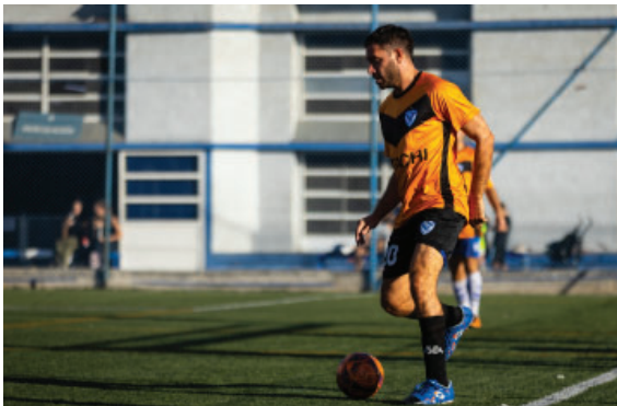
Torneo interno en el Campvs Victorio Spinetto.