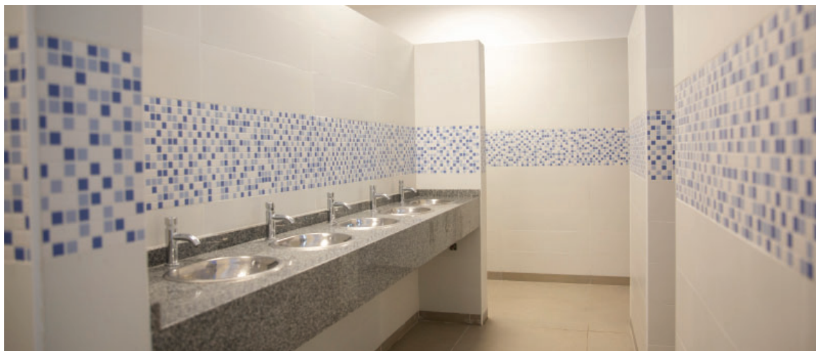
Se incorporaron nuevas luminarias, inodoros, mingitorios, mesadas y la correspondiente colocación de cerámicas.