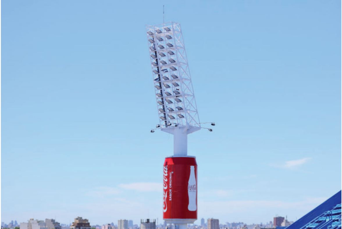
Obra histórica para nuestro Club, dejando atrás una tecnología de casi 50 años y renovando todas las luminarias del Estadio.