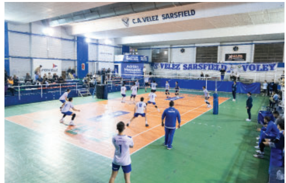
Vóley en el Estadio Ana Petracca.