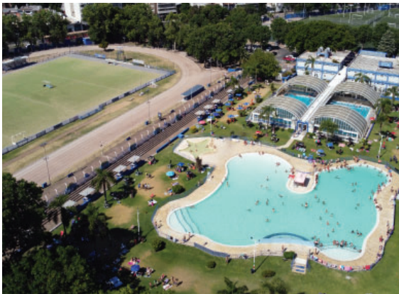
Temporada de Verano en el Polideportivo.