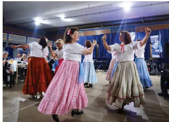
Fiesta de los 25 años de Cultura AFA celebrado en nuestro club.