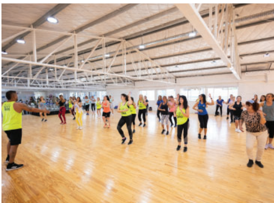
Muestra de Zumba en el Quincho del Polideportivo.