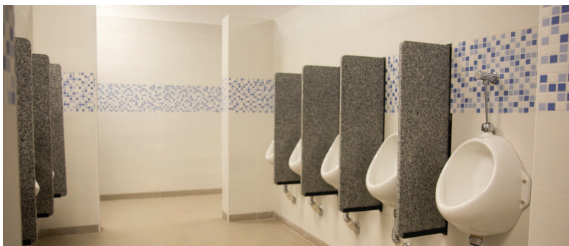
La obra constó del proceso de demolición de las instalaciones existentes para brindarle un mayor confort a los socios.