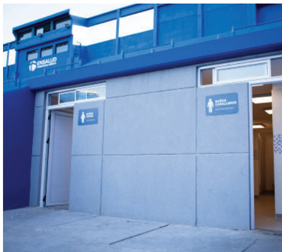
Renovación total de los baños de la Popular Oeste.