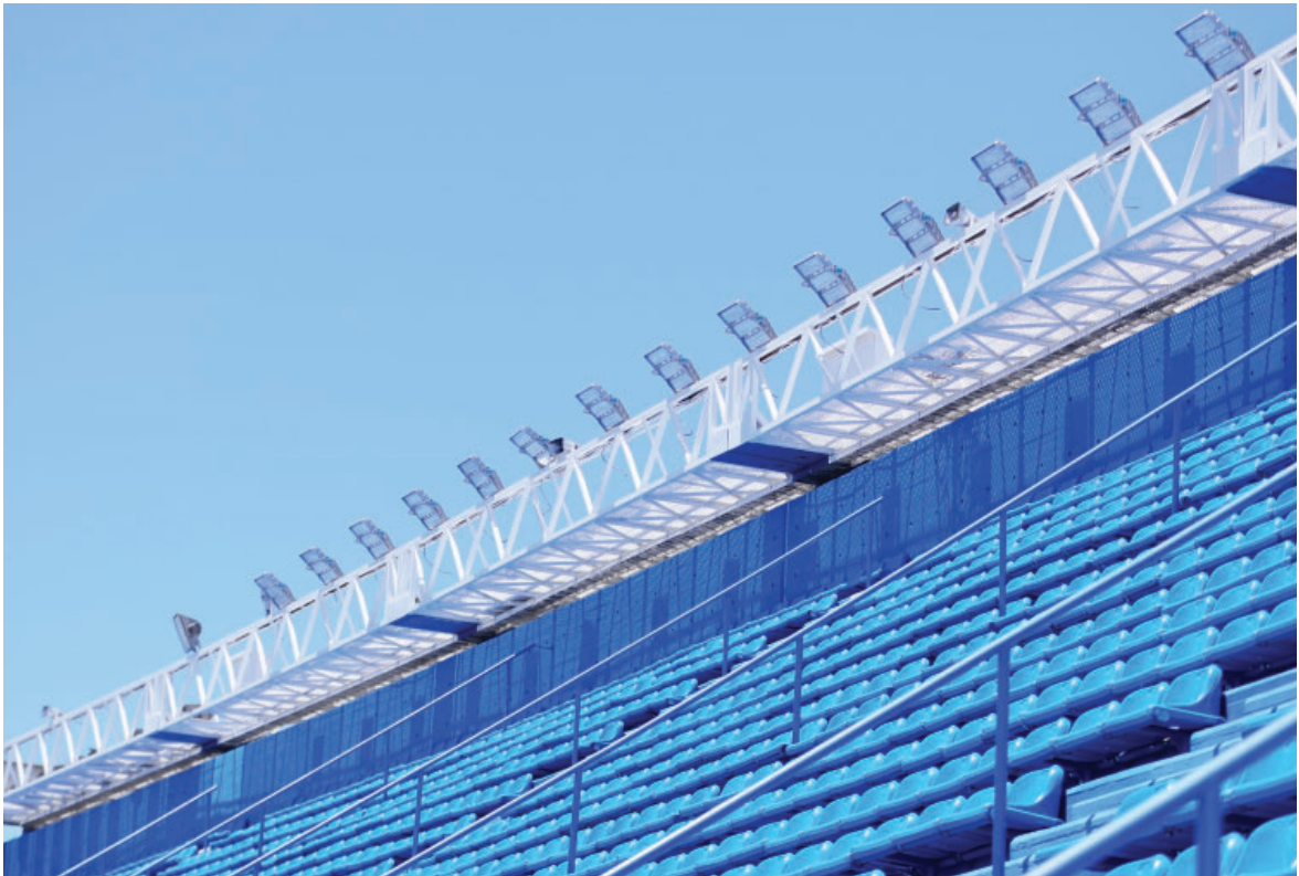
¡El Amalfitani brilla más que nunca con su nuevo sistema de iluminación LED!