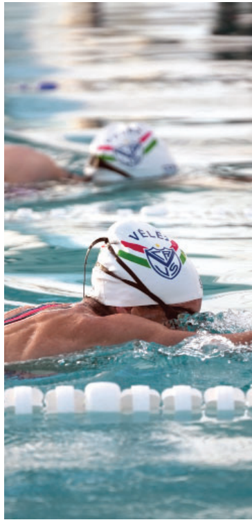
Natación en el Complejo acuático.