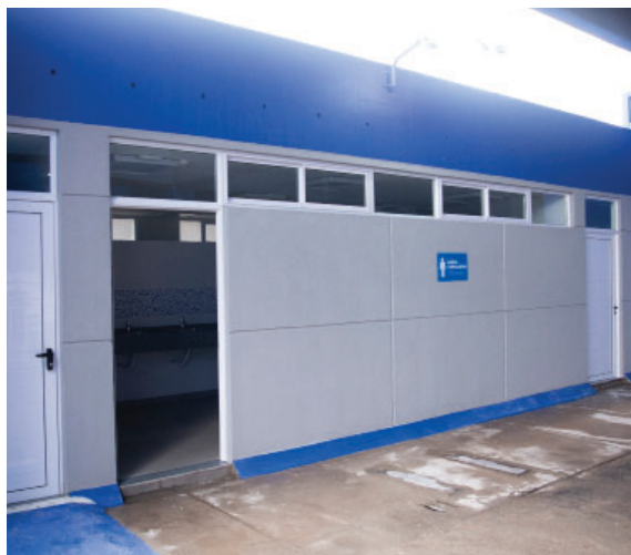
Renovación total de los baños de la Platea Bianchi Baja.

Ejercicio 115 - Del 1 de julio de 2024 al 30 de junio de 2025